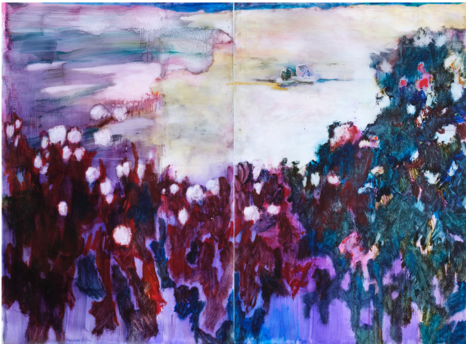
Sarah Jérôme, "Myriorama I", peinture à l'huile sur papier calque, diptyque 2x 137x200cm, 2023