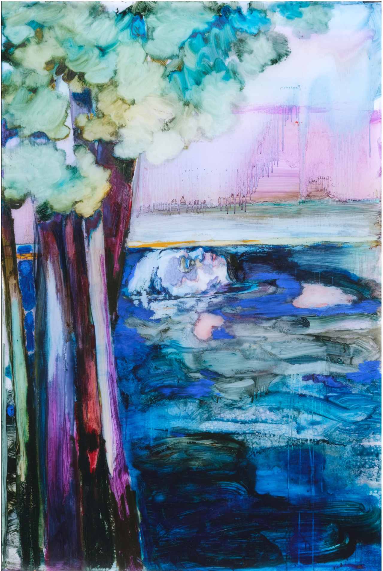
Sarah Jérôme, "Myriorama II", peinture à l'huile sur papier calque, 137x200cm, 2023