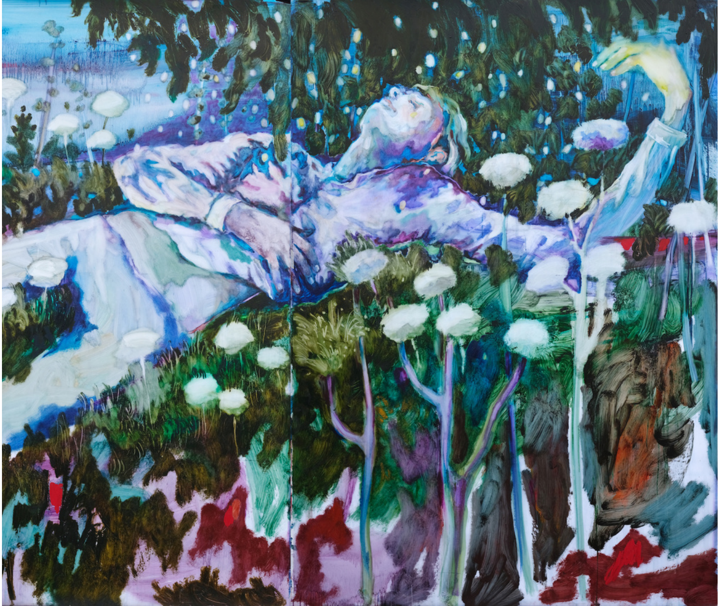
Sarah Jérôme, "Daydreamer IV" (détail), peinture à l'huile sur papier calque, triptyque 3x 137x200cm, 2023