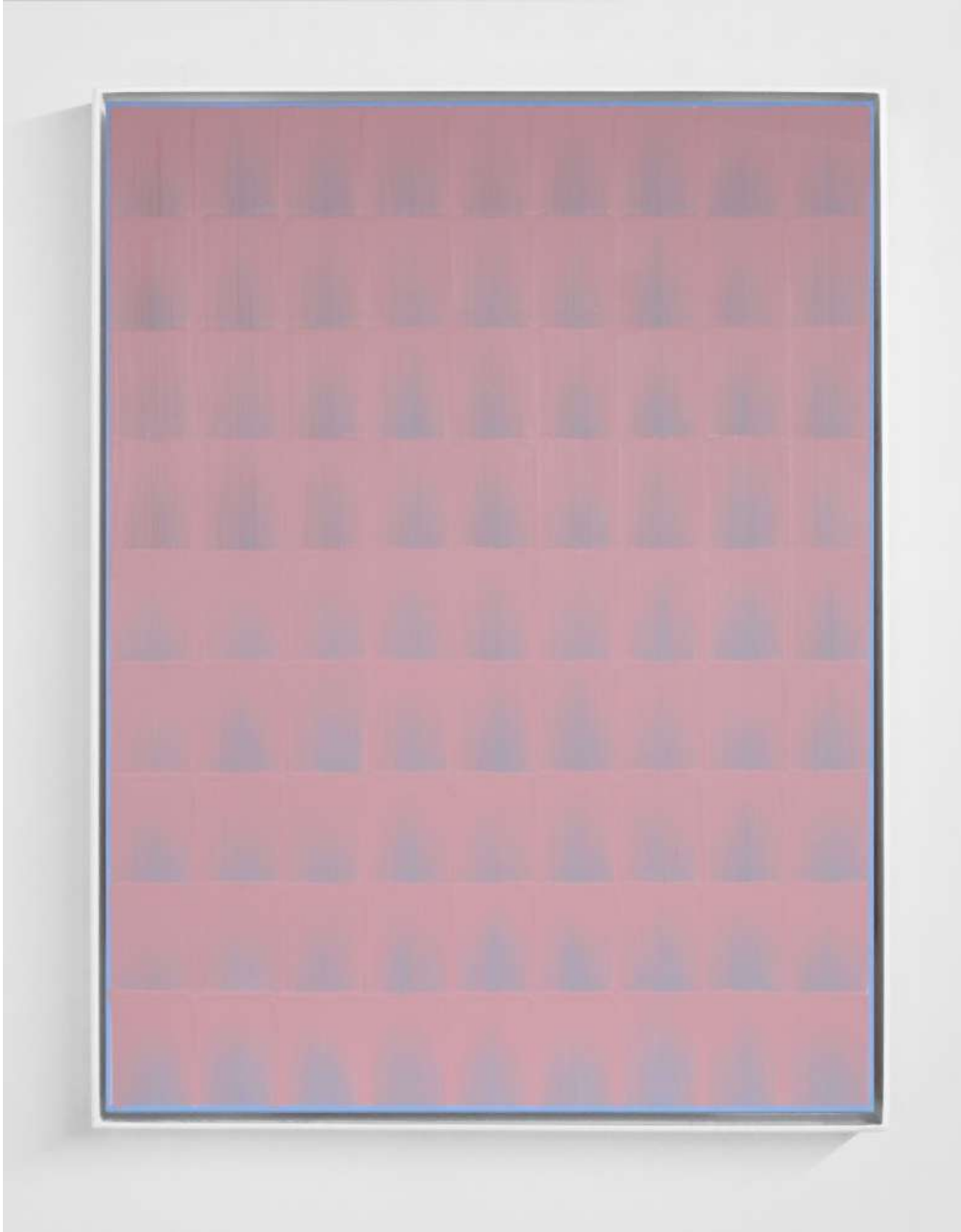
Peng Yong, trois mille mondes en un instant de vie n°98 , 2022, acrylique sur panneau composite aluminium, 60 x 45 cm