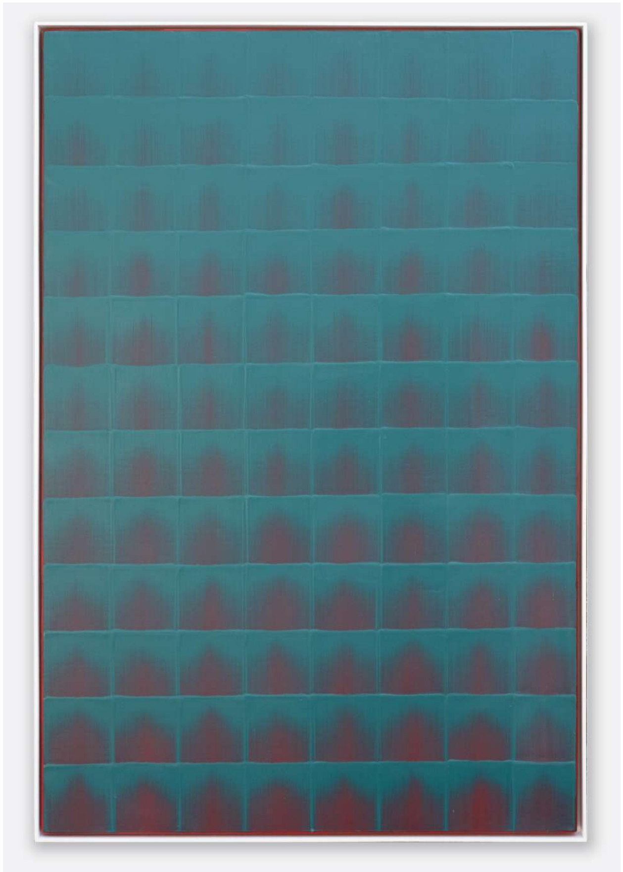
Peng Yong, trois mille mondes en un instant de vie n°5-2022 , 2022, acrylique sur toile, 122 x 82 cm