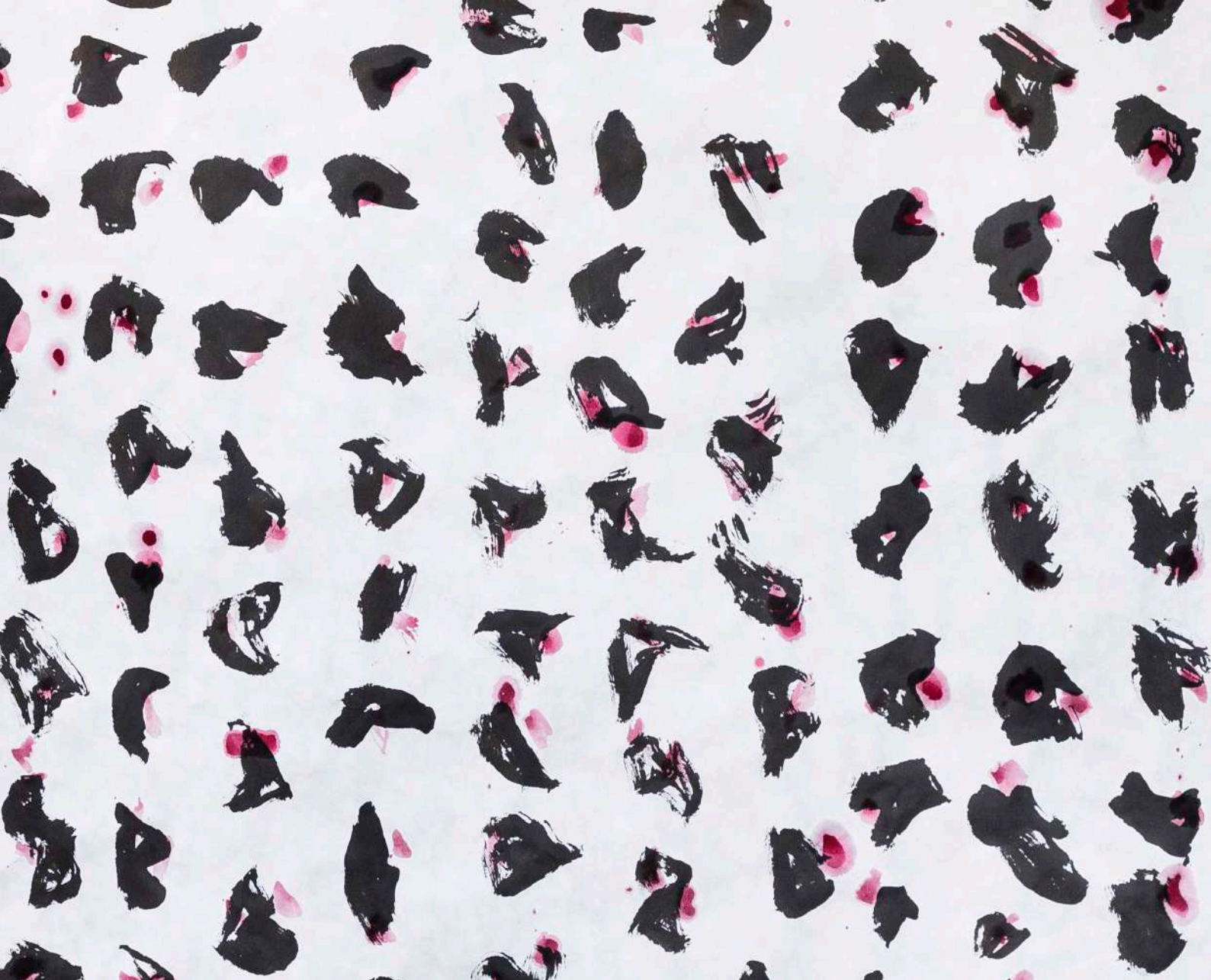
Park In-kyung, Pétales de rose (détail) , 2022, Encre sur papier hanji, 150 x 200 cm