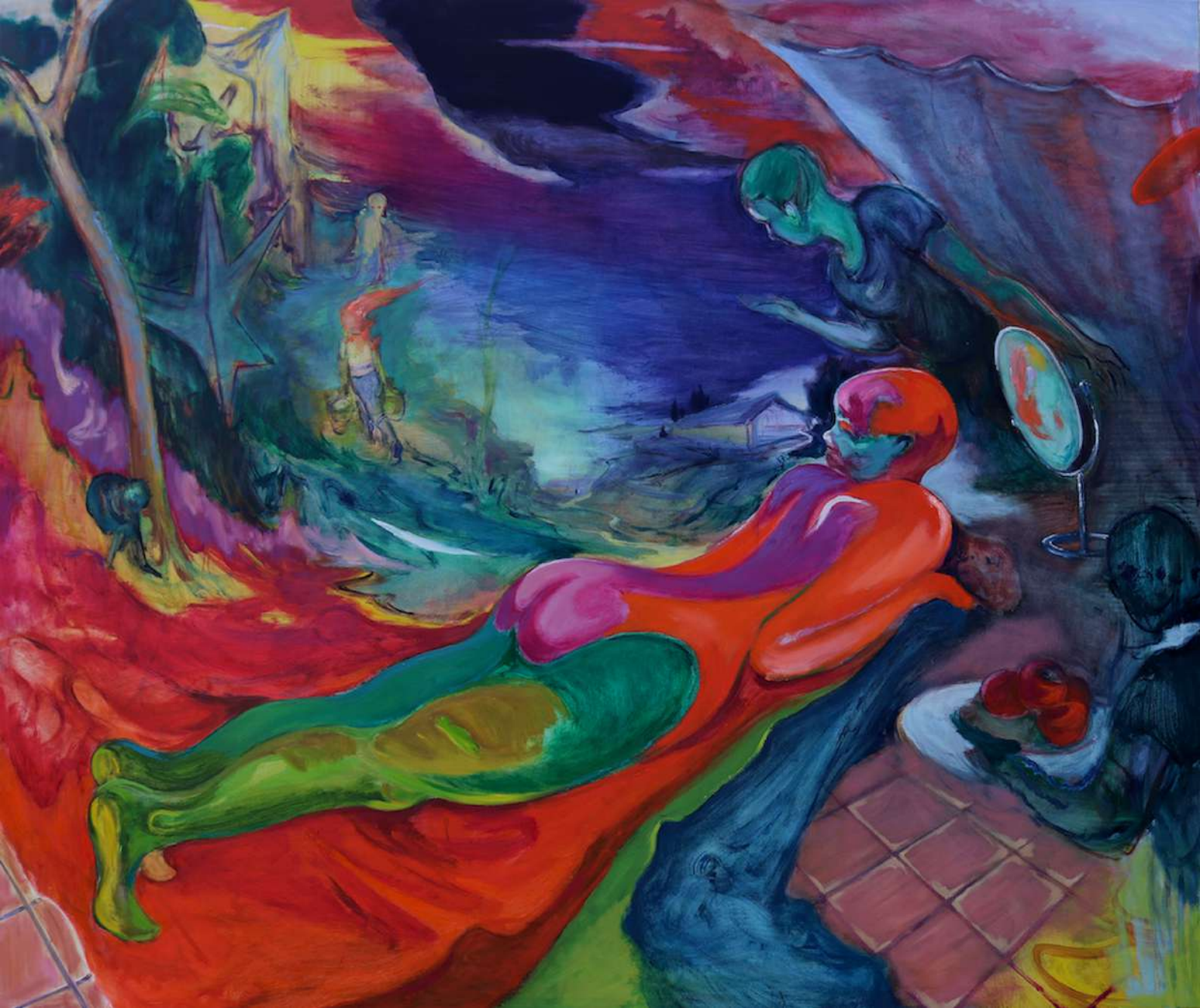
Rao Fu, Olympia , 2022, Huile sur toile, 155 x 185 cm