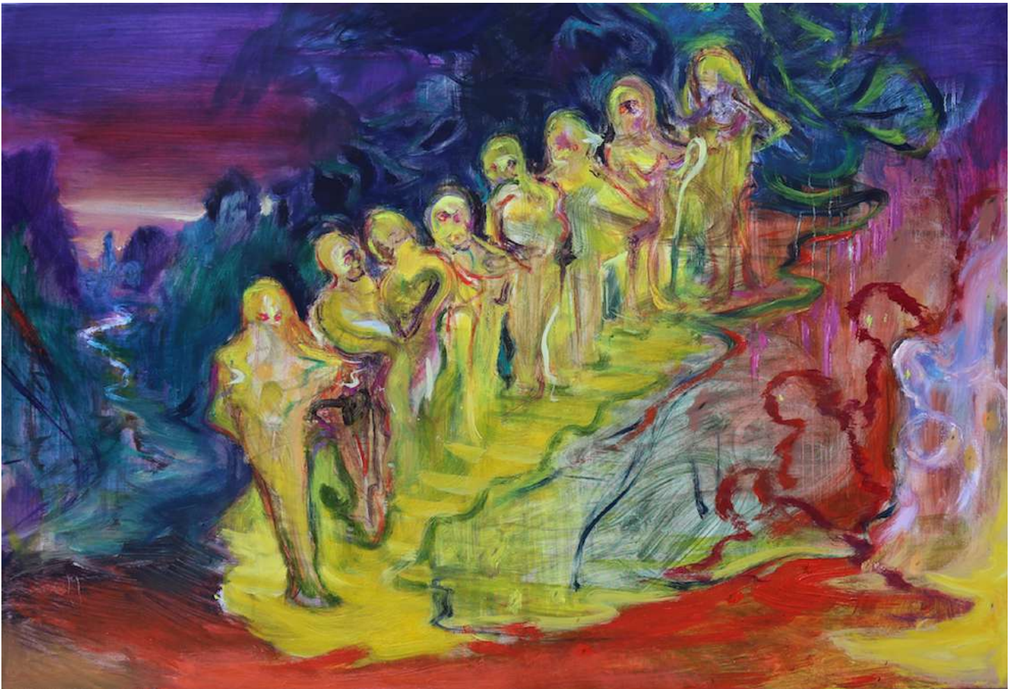
Rao Fu, Gala , 2022, Huile sur toile, 60 x 88 cm