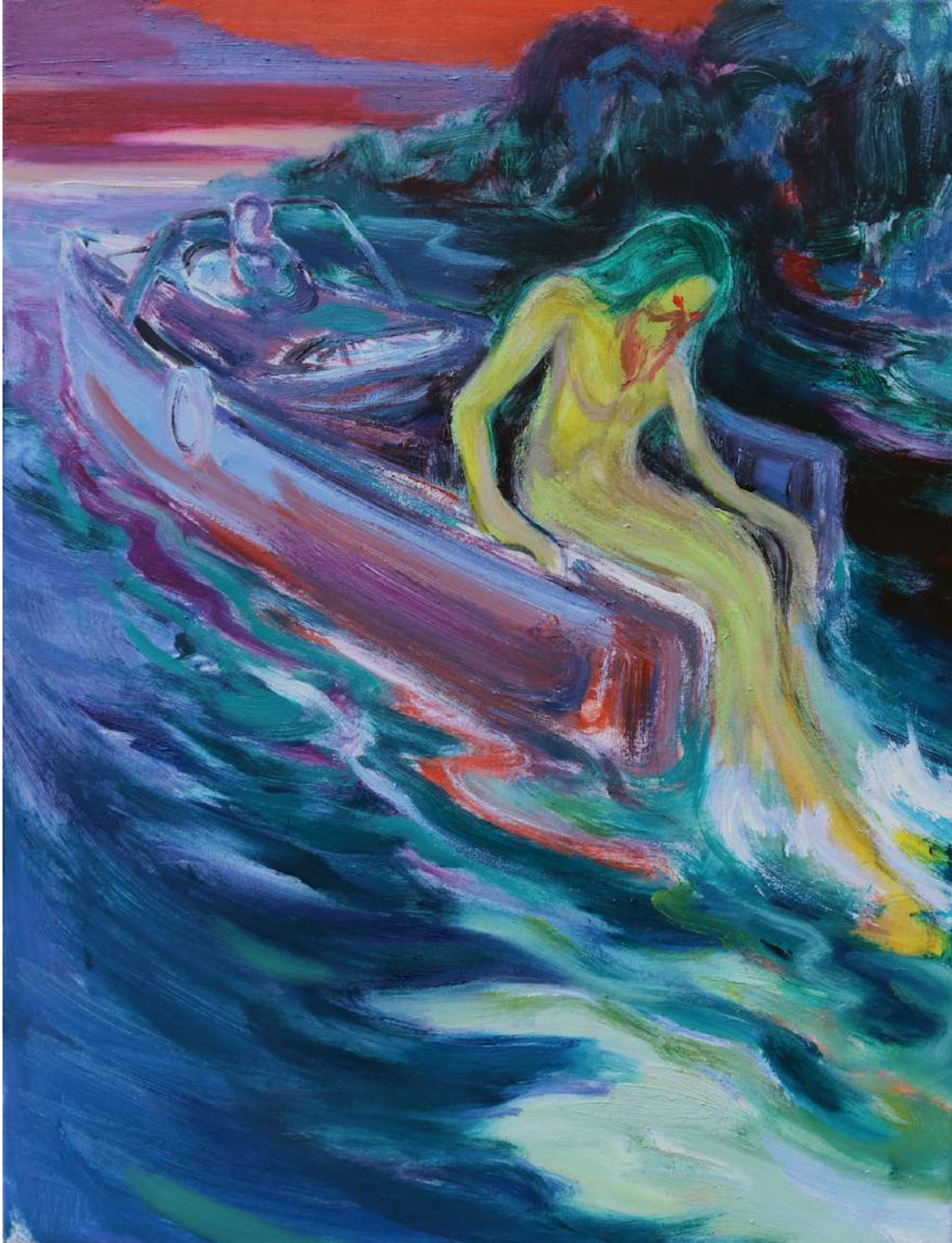
Rao Fu, Boat Song , 2022, Huile sur toile, 57 x 43 cm