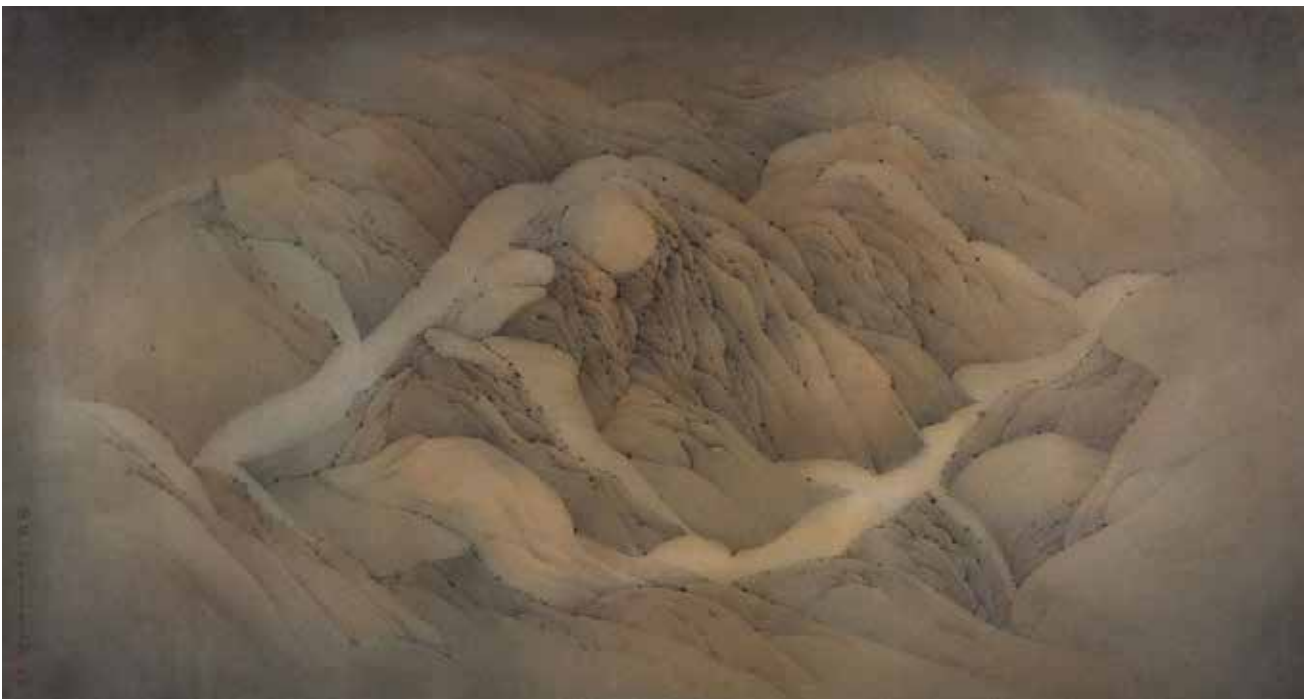
WUCIUS WONG, Seclusion , 1975, encre sur papier, 102 x 184 cm