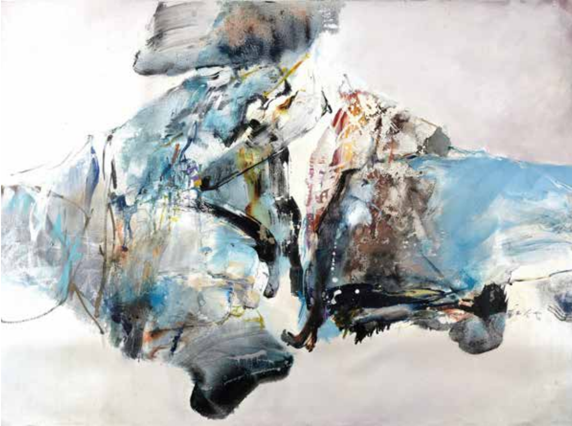
CHUANG CHE, The Great Rule , 1989, Huile et acrylique sur toile, 133 x 175 cm