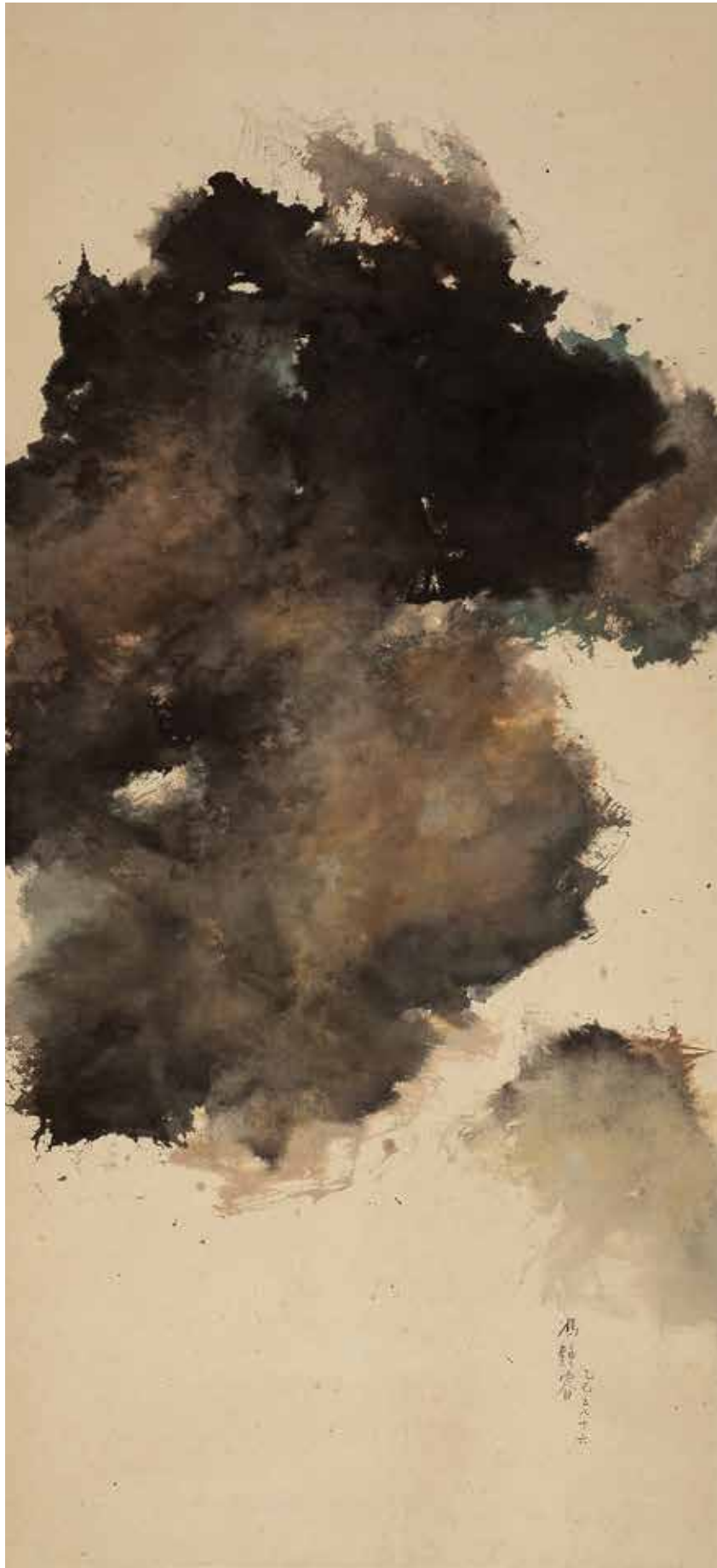
FONG CHUNG-RAY, Composition , 1965, encre sur papier, 119 x 54 cm © Luc Pâris