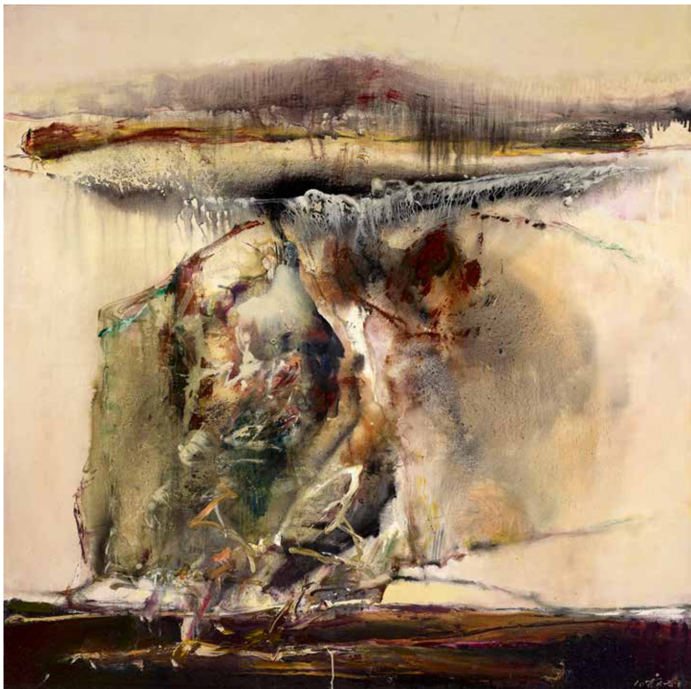
Ci-dessus - CHUANG CHE, Dream Cycle 3 , 2010, huile et acrylique sur toile, 168 x 168 cm