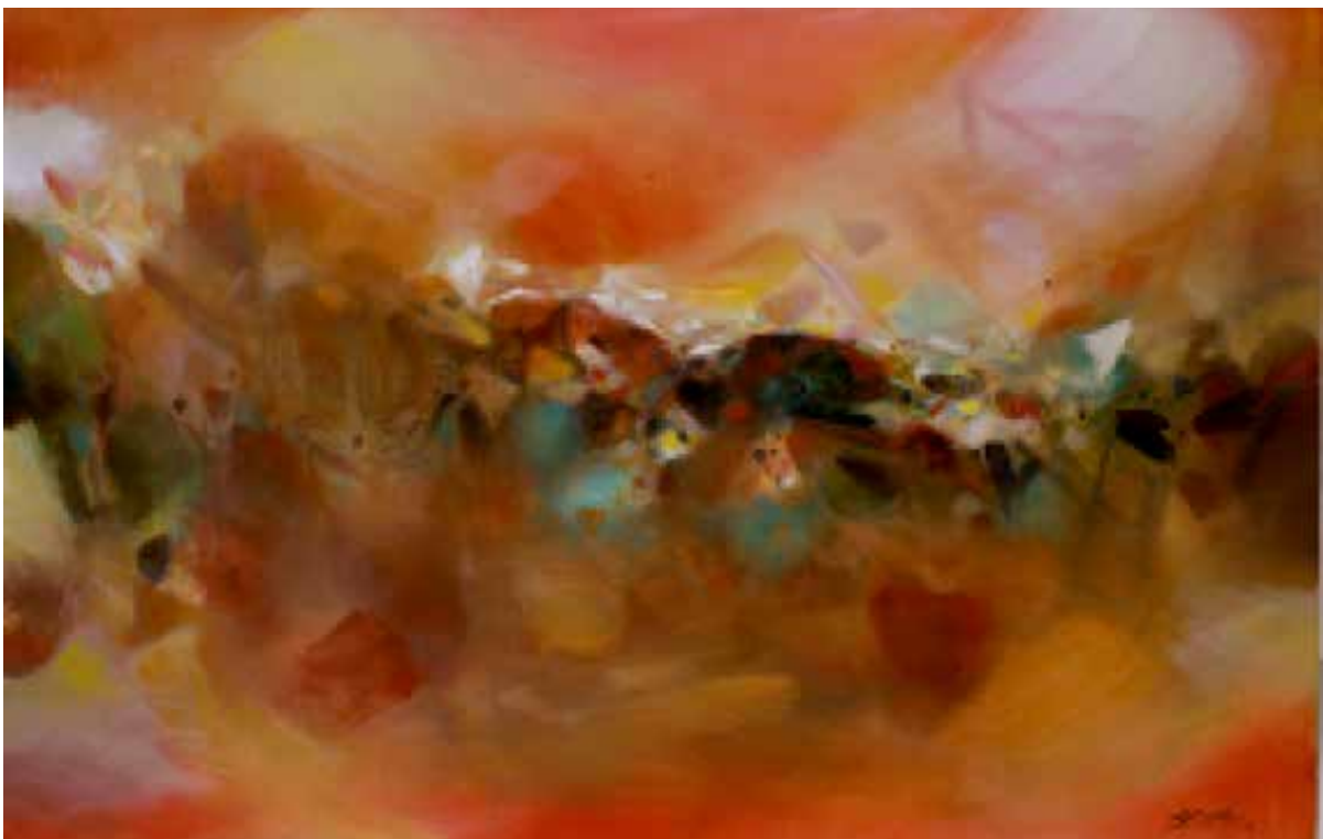
CHU TEH-CHUN, Chant de joie , 2006, huile sur toile, 130 x 195 cm © Adagp, Paris, 2021. Courtesy Fondation Chu Teh-Chun