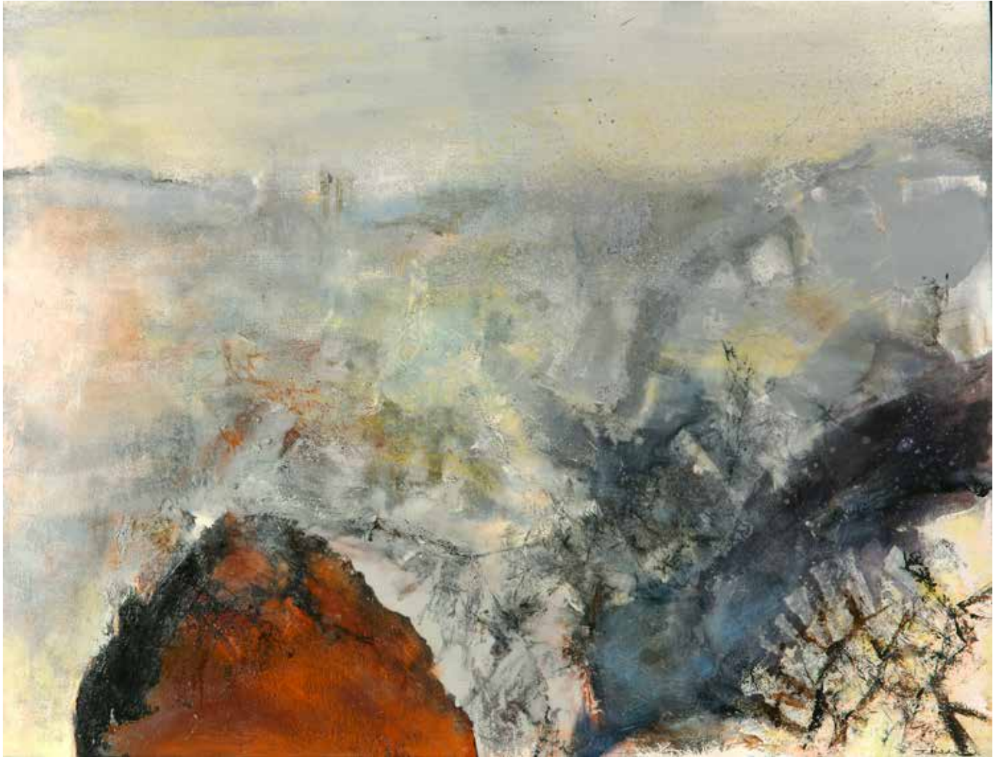
ZAO WOU-KI, Montagne Sainte Victoire, 1992-1993, huile sur toile, 114 x 146 cm