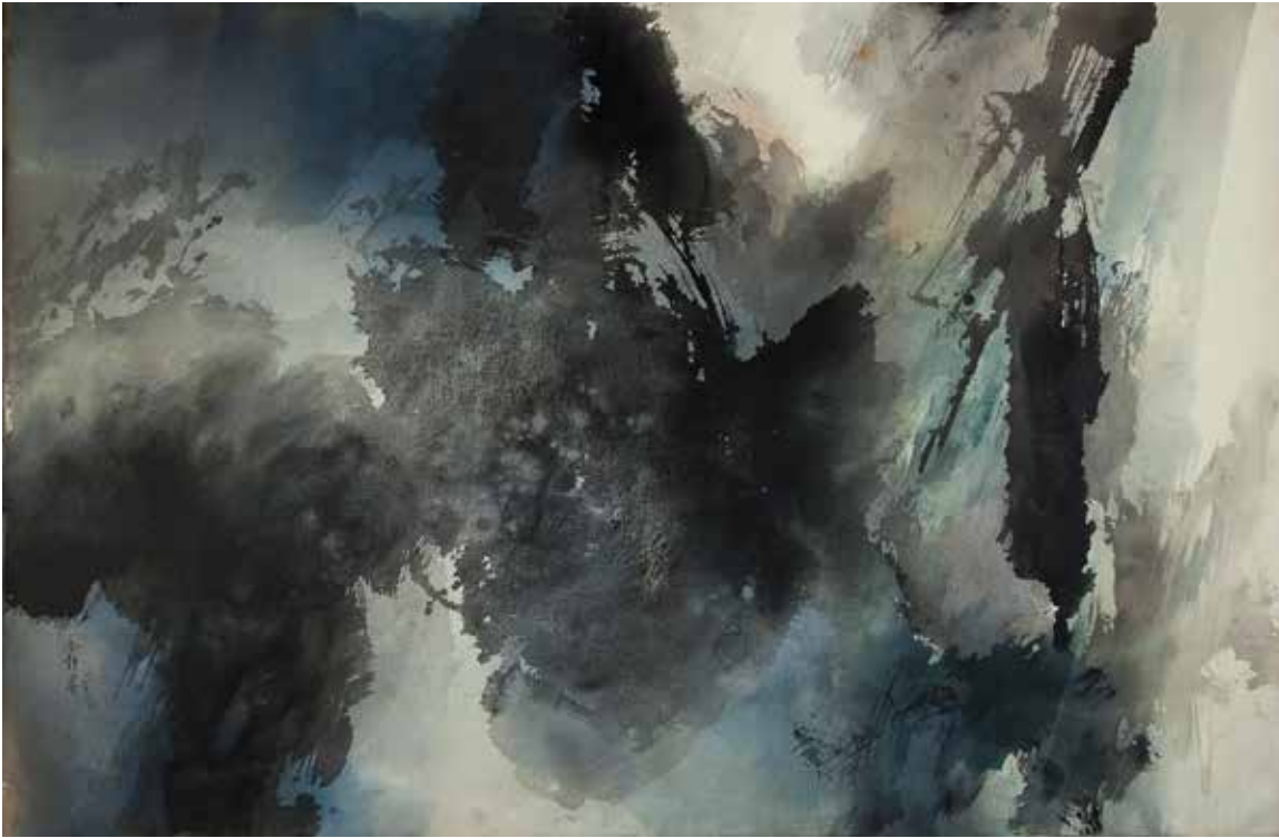
FONG CHUNG-RAY, Sans titre , 1982, acrylique et huile sur toile, 106 x 166 cm