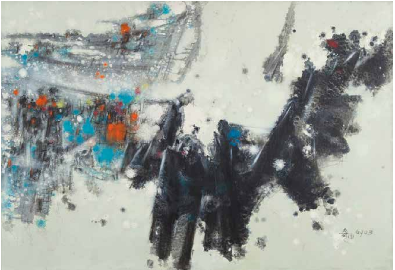
HU CHI-CHUNG, Sans titre , 1969, huile et sable sur toile, 80 x 116,5 cm