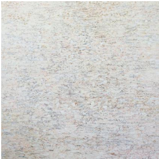
Paysage I , 2019, 200 x 200 cm, Papier Hanji, Encre de Chine, Acrylique