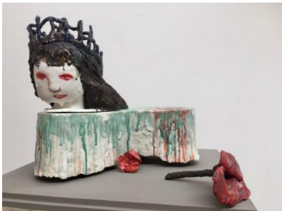
Paysage intérieur - Toucher de son ombre, 2013, Grès et porcelaine emmaillés, 46(H) x 40 x 31 cm