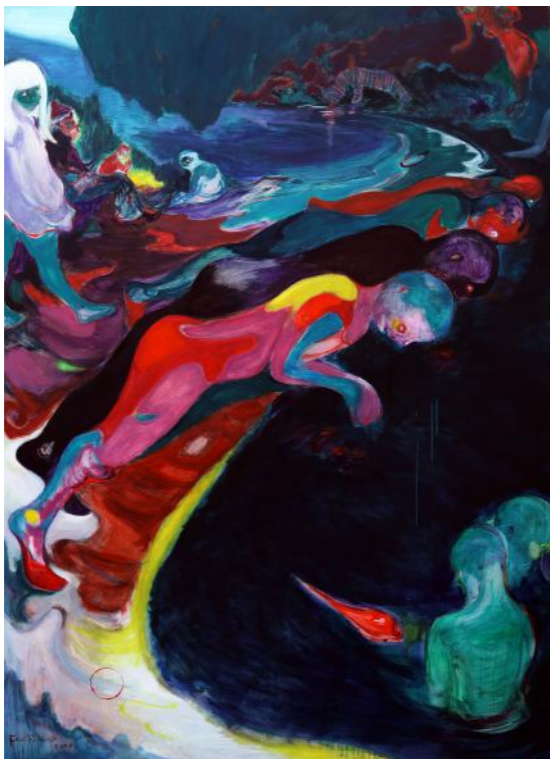
Fire Lake, 2020, 195 x 140 cm, Huile sur toile