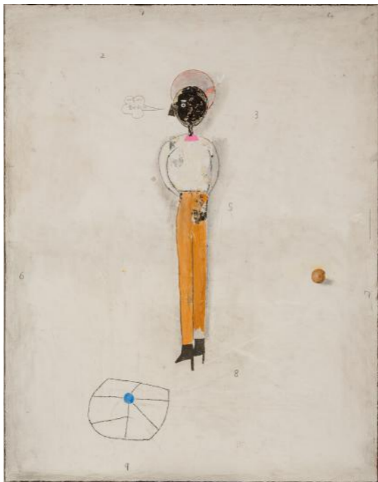
Sans titre , 2017, 117 x 91 cm, Techniques mixtes