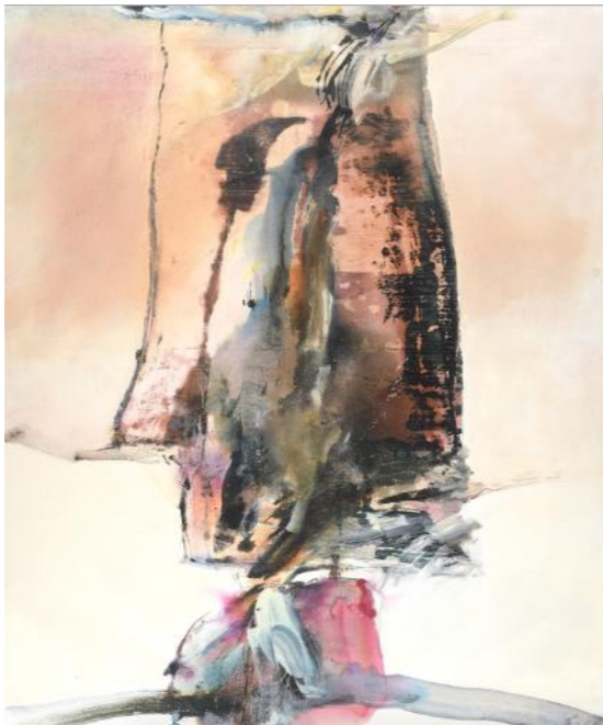
Sans titre , 1981, 153 x 128 cm, Huile et acrylique sur toile