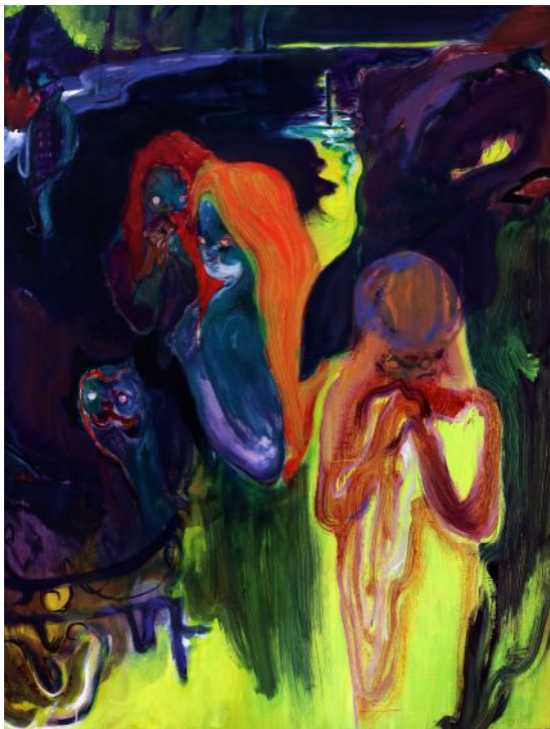
Kaguya, 2020, 120 x 90 cm, Huile sur toile