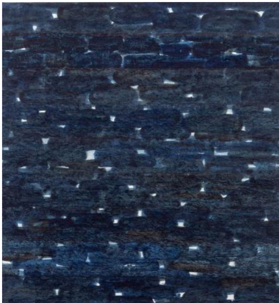
Aquatique I , 2019, 140 x 130 cm, Papier Hanji, Couleur végétale et minérale, Encre de Chine