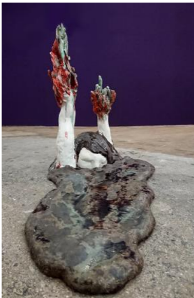
Paysage intérieur - L'oublie, 2019, Céramique, 42(H) x 32 x 76cm