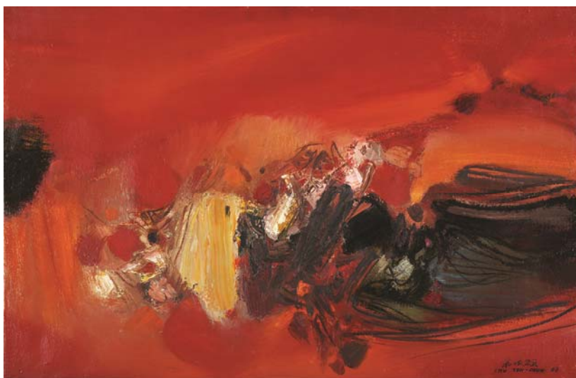
Chu Teh-Chun, sans titre , 1965 © SABAM 2017

Commissaire de l'exposition : Sabine Vazieux