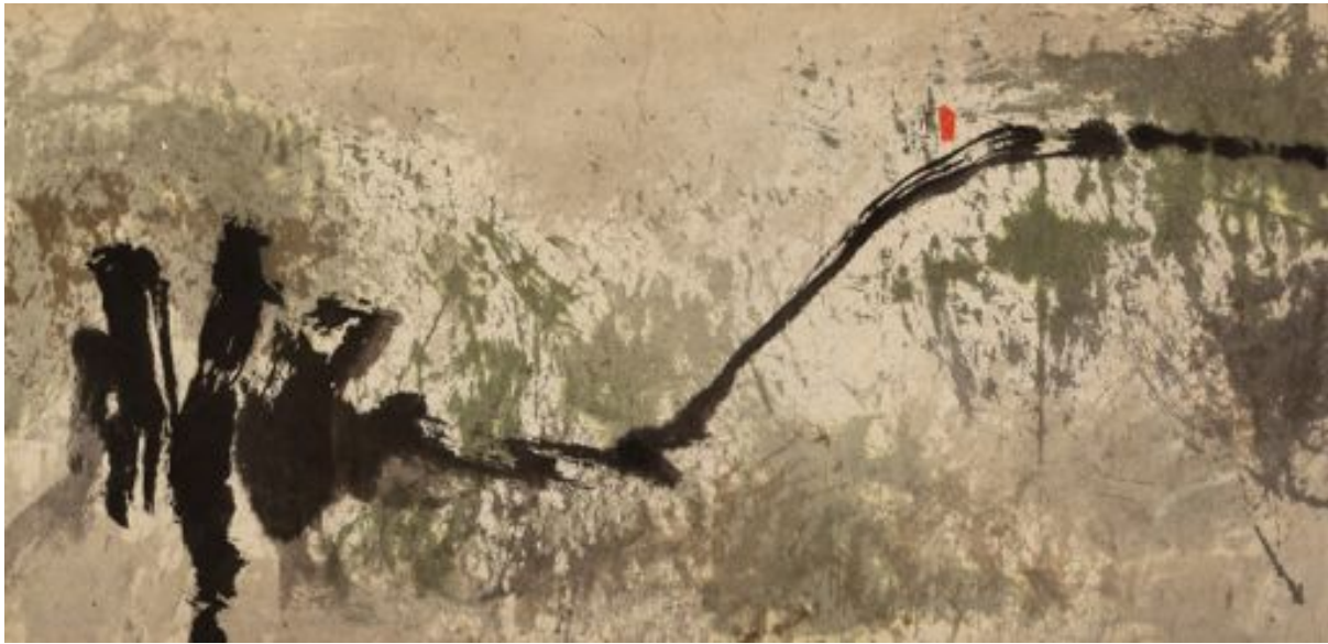
Fong Chung-Ray Composition, 1964 Encres sur papier Signé en haut à droite - 59 x 119 cm