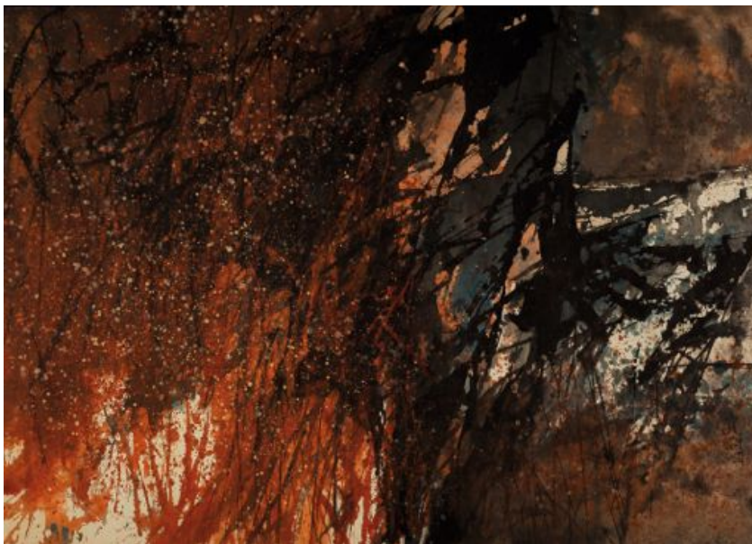
Fong Chung-Ray Composition, 1975 Technique mixte sur papier marouflée sur toile Signé en bas à droite - 80,5 x 115,5 cm