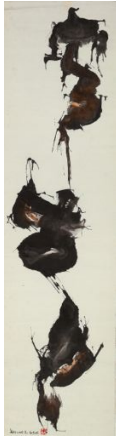
Hsiao Ming-Hsien Flowing, 1963 Encres sur papier Signé et daté en bas à gauche - 133,5 x 35 cm