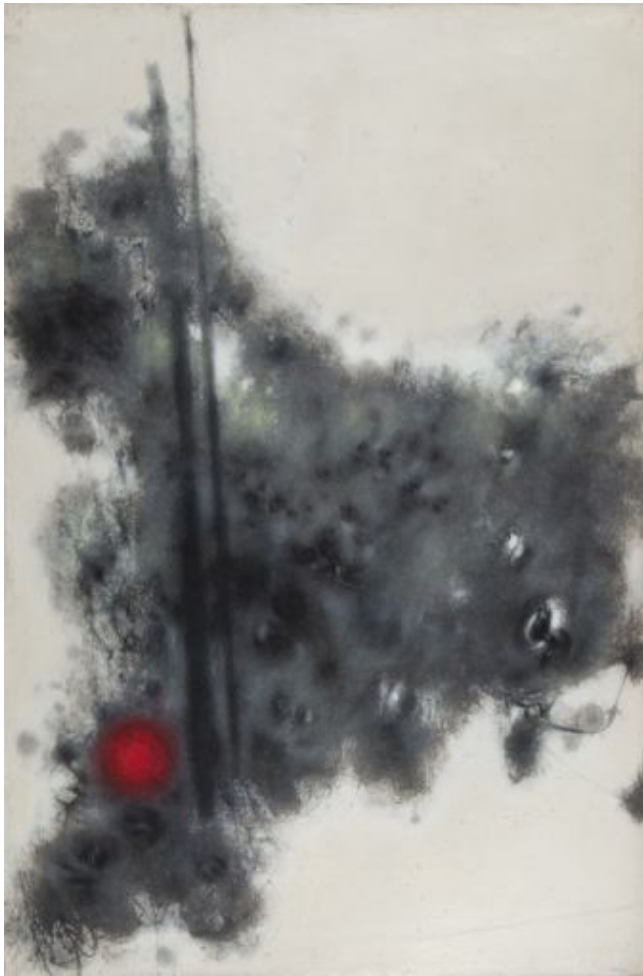
Hu Chi-Chung Composition, 1963 Huile et sable sur toile Signé en bas à droite - 138 x 92 cm