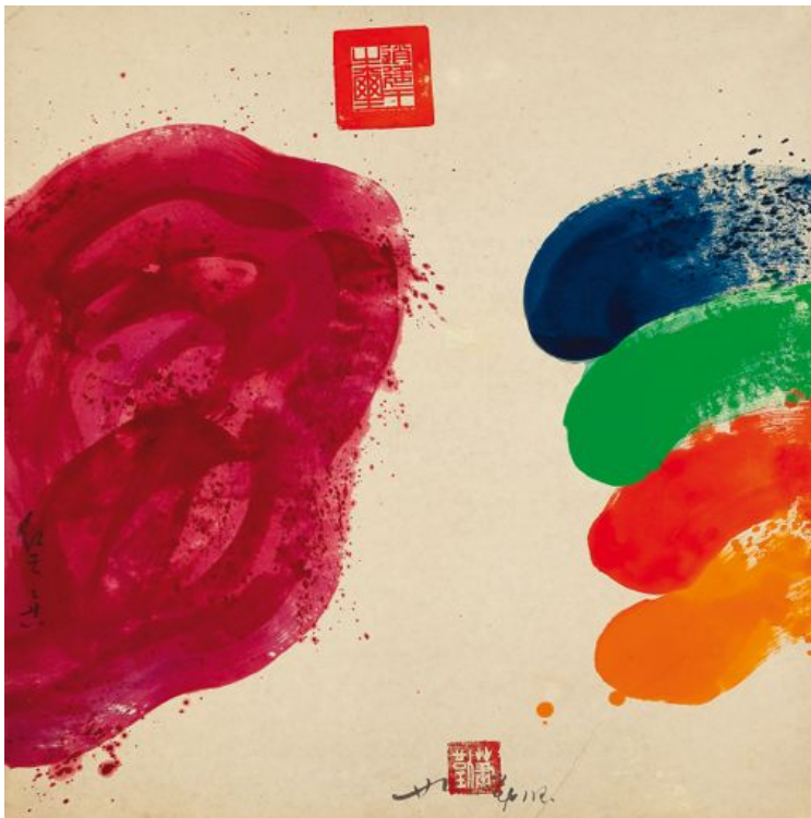
Hsiao Chin Red cloud, 1985 Papier marouflé sur toile Signé en bas - 82 x 82 cm