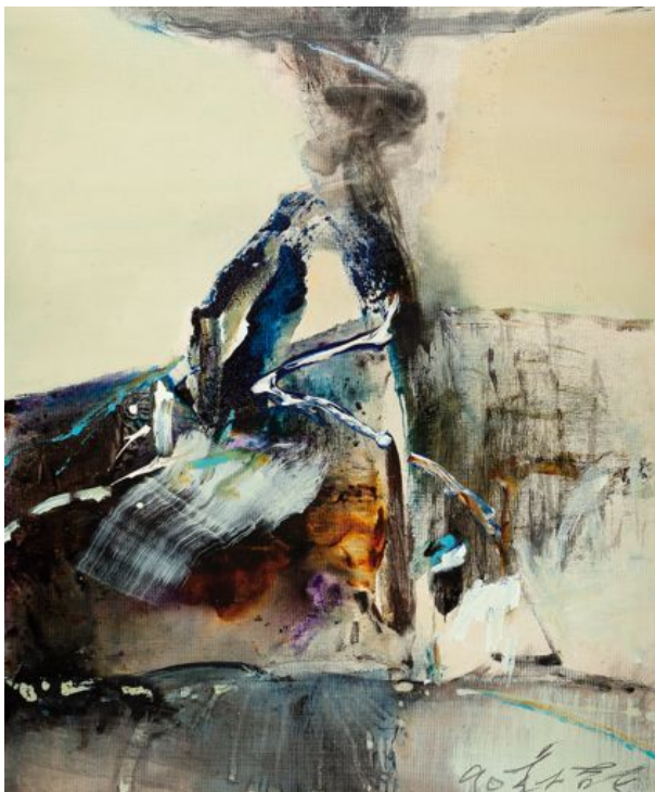
Chuang Che Composition, 1990 Acrylique et huile sur canvaset Signé et daté bas droite - 60 x 50 cm