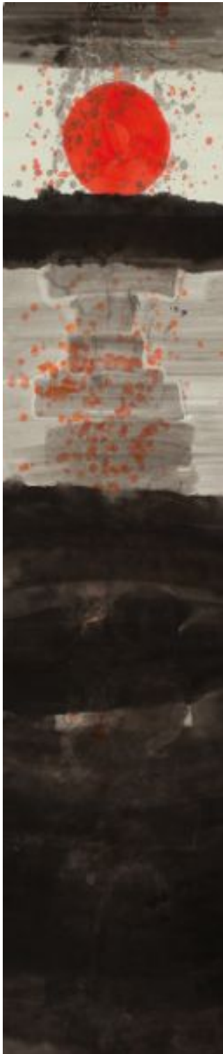
Hsiao Ming-Hsien Pink on circle, 1963 Encres sur papier Signé - 137 x 35 cm