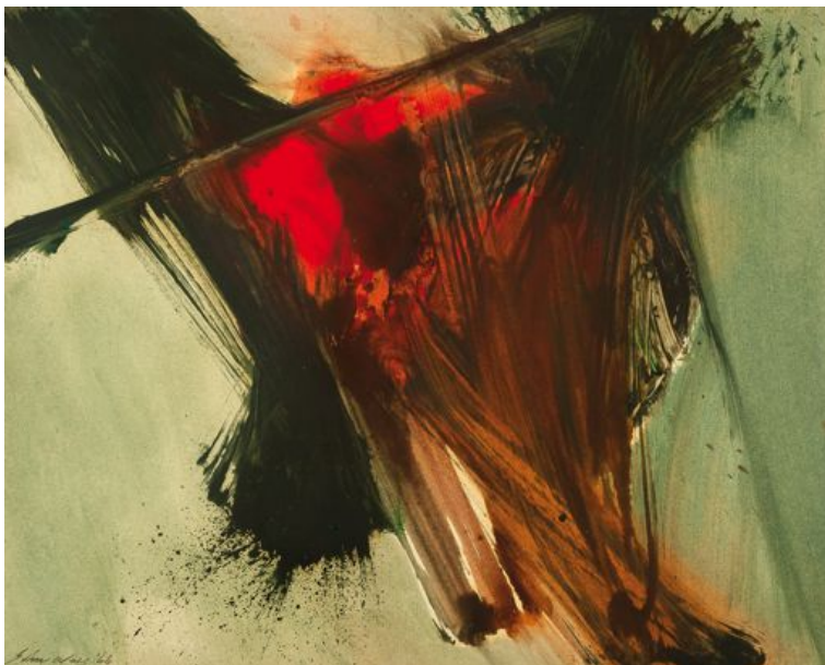
John Way Composition, 1966 Huile sur papier Signé et daté en bas à droite - 48,5 x 61 cm