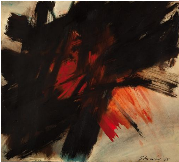
John Way Composition, 1965 Huile sur papier Signé et daté en bas à droite - 46 x 61 cm