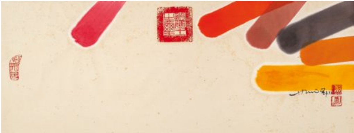
Hsiao Chin Composition Encres sur papier Signé en bas à droite - 36.5 x 94 cm